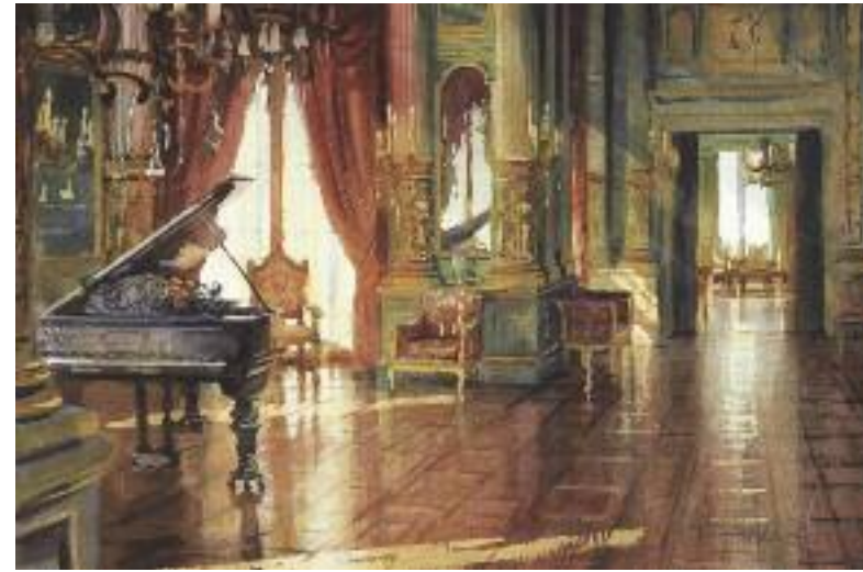
The Music Room Enfilade at the Breakers. Newport. 2004. Aquarelle, 38 x 56 cm.

Ma réputation comme peintre d'architecture m'a amené de nombreux travaux de commande qui m'ont rapidement ennuyé. Pourtant, mon enthousiasme est revenu en 2000 quand je suis parti aux États-Unis peindre les intérieurs de musées et de grandes demeures américaines. Dans leur poursuite de l'héritage des Lumières, les Américains ont construit grand et somptueux. C'est un défi qui me plaisait et m'a poussé moi aussi à voir grand. Sur des feuilles de deux mètres de long, j'ai peint ces intérieurs à l'architecture fouillée où les éléments de décoration ne se perçoivent véritablement qu'avec un crayon, non à travers le viseur de l'appareil photo. L'œil se balade ainsi d'un élément à un autre pour en saisir les