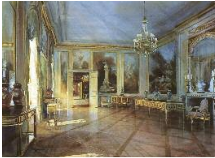
The Fragonard Room in the Frick Museum. New York. 2000. Aquarelle, 56 x 76 cm.

Ma réputation comme peintre d'architecture m'a amené de nombreux travaux de commande qui m'ont rapidement ennuyé. Pourtant, mon enthousiasme est revenu en 2000 quand je suis parti aux États-Unis peindre les intérieurs de musées et de grandes demeures américaines. Dans leur poursuite de l'héritage des Lumières, les Américains ont construit grand et somptueux. C'est un défi qui me plaisait et m'a poussé moi aussi à voir grand. Sur des feuilles de deux mètres de long, j'ai peint ces intérieurs à l'architecture fouillée où les éléments de décoration ne se perçoivent véritablement qu'avec un crayon, non à travers le viseur de l'appareil photo. L'œil se balade ainsi d'un élément à un autre pour en saisir les