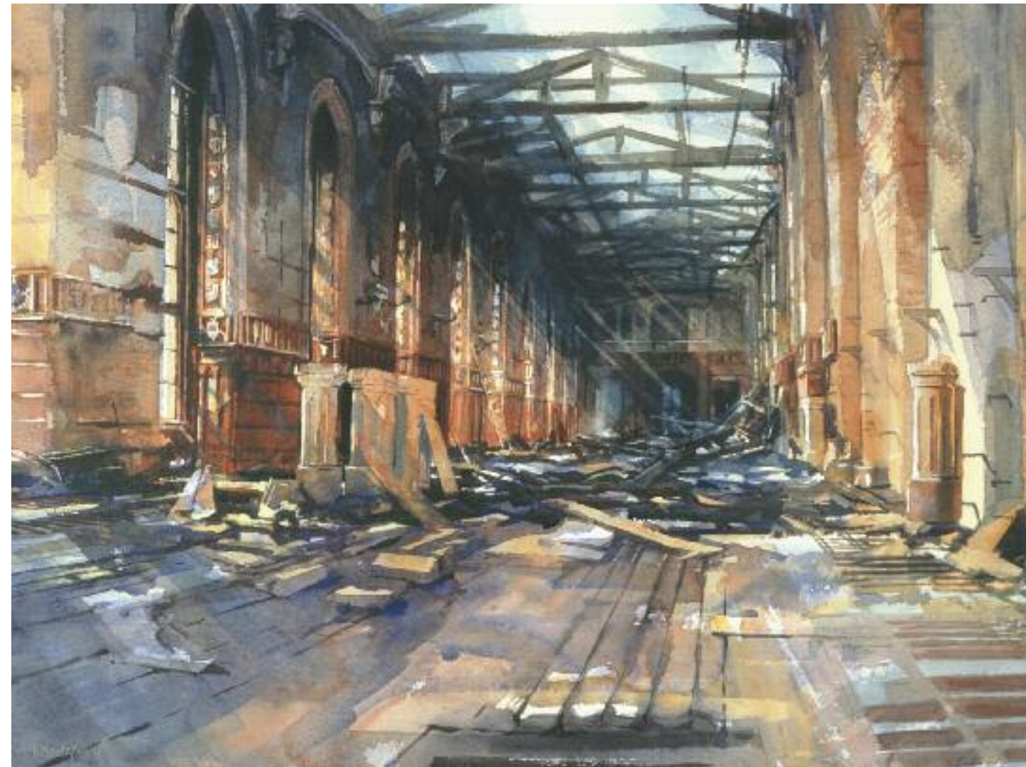
Windsor Castle after the Fire, St. George's Hall. 1993. Aquarelle, 56 x 76 cm. © H. M. Queen Elizabeth II, 1993.