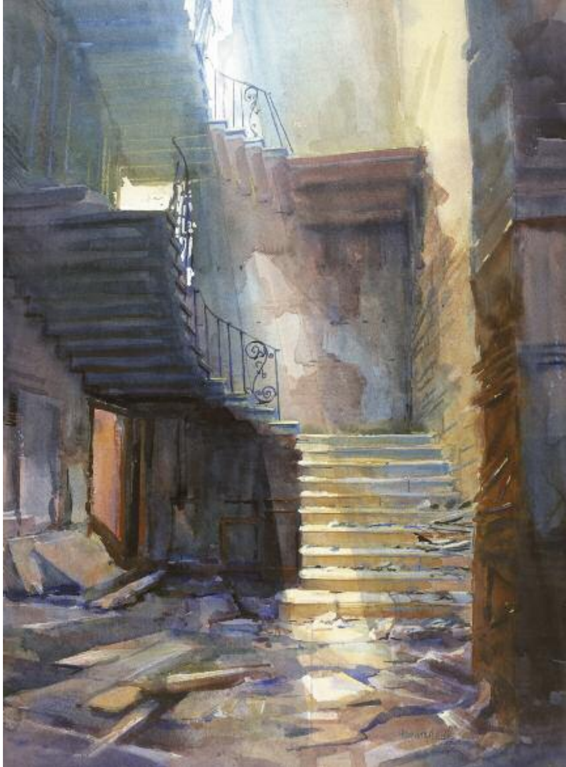
Three Storeys of Stairs – Cams Hall. Extrait de Silent Houses of Britain . 1991. Aquarelle, 76 x 56 cm.